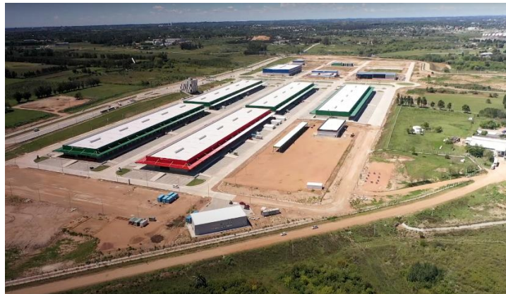
Unidad Agroalimentaria Metropolitana