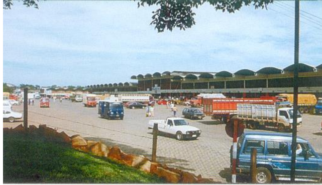
Dirección de Abastecimiento de la Municipalidad de Asunción (DAMA).