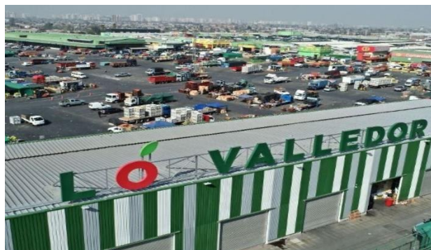
Mercado Mayorista Lo Valledor Avenida Maipú 3301, comuna de Pedro Aguirre Cerda, Región Metropolitana